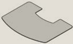
TT44 Glas: 30-944