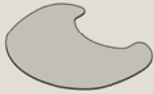
TT20, TT21, TT23 Glas: 30-907