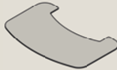
TT80 Glas: 30-914