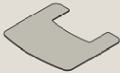
TT30 Glas: 30-909