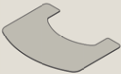
TT22, TT55 Glas: 30-910